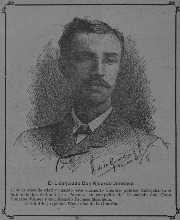
El Licenciado Don Ricardo Jiménez